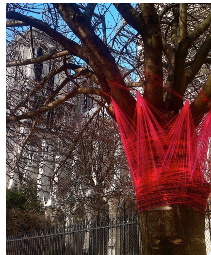
«Wollgrafitti» di Bettina Baltensweiler Per tutto il mese di giugno troverete l'istallazione nel nostro cortile