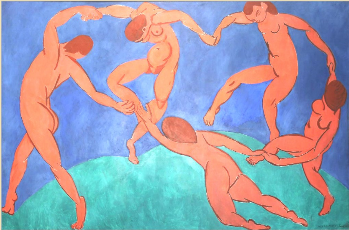
La Danza di H. Matisse

L'accostamento tra la Pentecoste e il ballare non appaia irraguardoso. A proporlo è stato uno dei più dotti teologi del Cinquecento: Pier Martire Vermigli (1499-1562), di cui porta il nome il liceo linguistico fondato dalla nostra chiesa qui a Zurigo. In un celebre sermone che fu all'origine della conversione di un altro illustre personaggio della vita religiosa italiana del XVI secolo, il marchese napoletano Galeazzo Caracciolo (1517-1586) finito esule a Ginevra, così si esprimeva Vermigli: