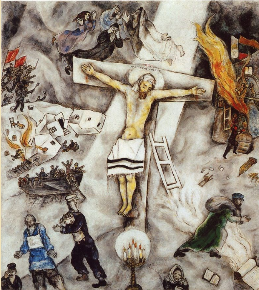
“Crocifissione bianca” di Marc Chagal

Il falegname, proprio ammattito, aggiunse ancora: “E poi è inutile fissargli i piedi a un palo: camminerà sempre, come la verità e l’amore”.